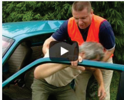
Video 6: Vyproštění z vozidla

Při nehodě je třeba dbát na vlastní bezpečnost a technickou první pomoc. Používáme předepsané vesty a výstražné trojúhelníky, vypneme zapalování havarovaného vozidla. Přivoláme zdravotnickou záchrannou službu a případně i další složky integrovaného záchranného systému. Při havárii vozidla je vždy podezření na poranění hlavy a páteře. Při poranění páteře, která chrání před poraněním míchu, by mohlo při nestabilní zlomenině obratlů dojít během manipulace k jejich posunu a poškození míchy. S postiženou osobou ve vozidle proto hýbeme jen v případě nutnosti, jako jsou hrozící požár, bezvědomí, závažné poranění, které nejde jinak ošetřit.