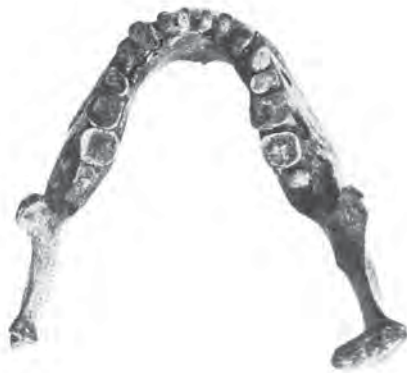
Dolní čelist muže Dolní Věstonice XVI. Poúrazová deformace kloubních výběžků.

Bagrování pokračovalo i v roce 1987. V bezprostřední blízkosti velkého ohniště s nadměrnou koncentrací dřevěného uhlí a spáleného dřeva odkryli další rituální pohřeb dospělého muže (DV XVI) uloženého ve skrčené poloze na pravém boku. I jeho kostra byla zasypána červeným barvivem. Opodál hrobu byly nalezeny jednotlivé lidské kosti a volné zuby.