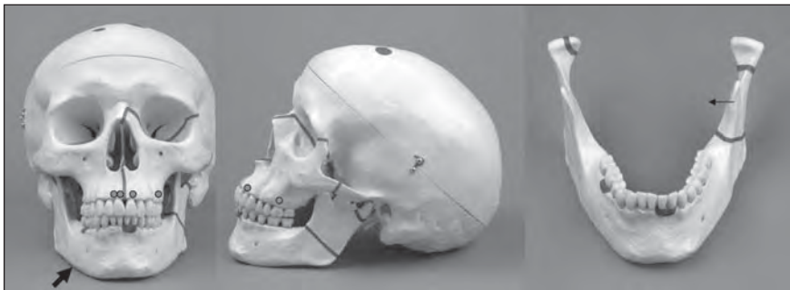
Znáznornění lomných linií a osteolytických ložisek na modelu lebky

Na čelní kosti byly patrné dvě jizvy, stejně jako u muže Dolní Věstonice XIII dobře vyhojené. Muž utrpěl velmi těžké zranění kostí obličeje. I když byla lebka postmortálně poškozená, přesto bylo patrné, že zlomenina postihla horní čelist a lícni kost na levé straně. Lomná linie procházela dolním okrajem nosního vchodu na pravé straně, sbíhala na levou polovinu alveolárního hřebene a doslova rozpoltila tvrdé patro. Nárazem došlo k oddělení kostního bloku levé strany zahrnujícího horní čelist, lícni kost a lícni oblouk, čili šlo o dislokovanou zlomeninu zygomaticomaxilárního komplexu, která srostla schodovitou deformací. Ta se po vstřebání otoku projevila propadnutím lícni krajiny. Muž musel mít diplopii v důsledku poklesu spodiny očníce i očního bulvu, a proto nestejnou výšku obou zrakových rovin.