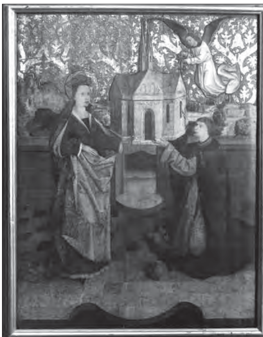
Mistr Puchnerovy archy, Sv. Anežka Česká předává kostel prvnímu velmistrovi řádu křižovníků s červenou hvězdou Albrechtovi ze Šternberka