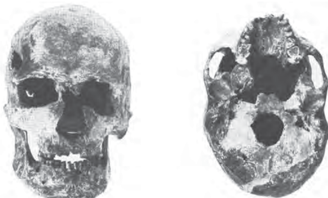
Lebka Dolní Věstonice XVI. Deformace střední třetiny obličeje vlevo a vertikální postavení vzestupného ramene dolní čelisti a deformace lícního oblouku a samotné kosti.

pohřbených a o určité, okamžitě vzniklé situaci, která měla v představě režiséra a aktérů v hrobě rekonstruované scény, plynulé pokračování v posmrtném životě.