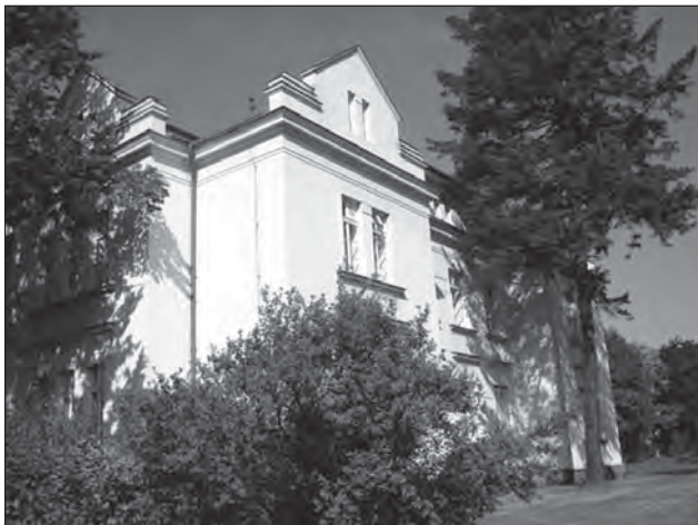
Psychiatrické centrum Praha