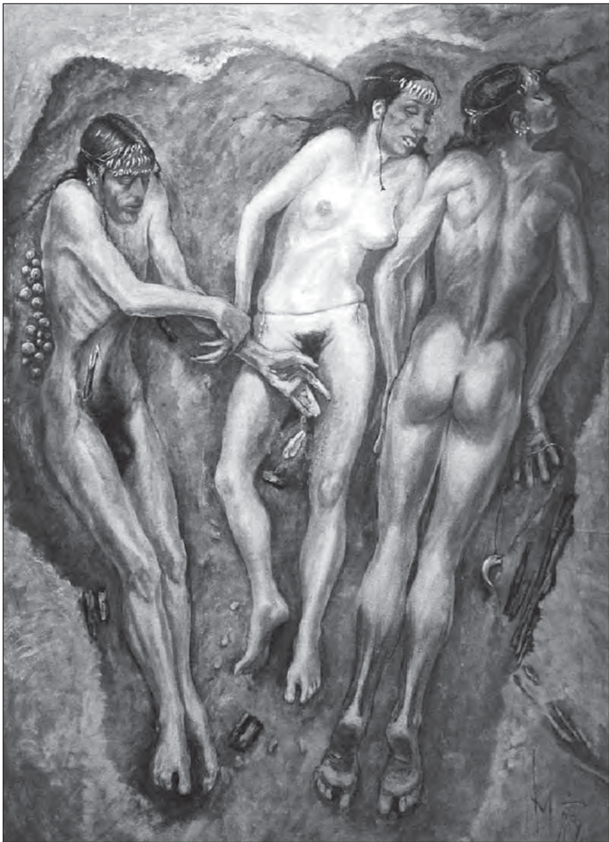
Realistické zobrazení tří jedinců z hrobu odkrytého v roce 1986. Autorem obrazu je akademický malíř Milan Med.