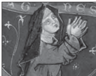
Anežka Česká v Oseckého lekcionáři