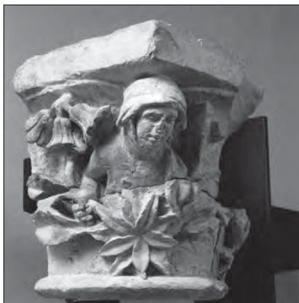
Anežka Česká v katedrále sv. Víta