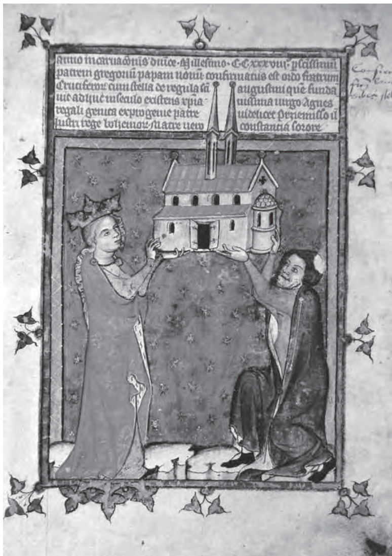
Breviř velmistra Lva – Aneřka Āeskā